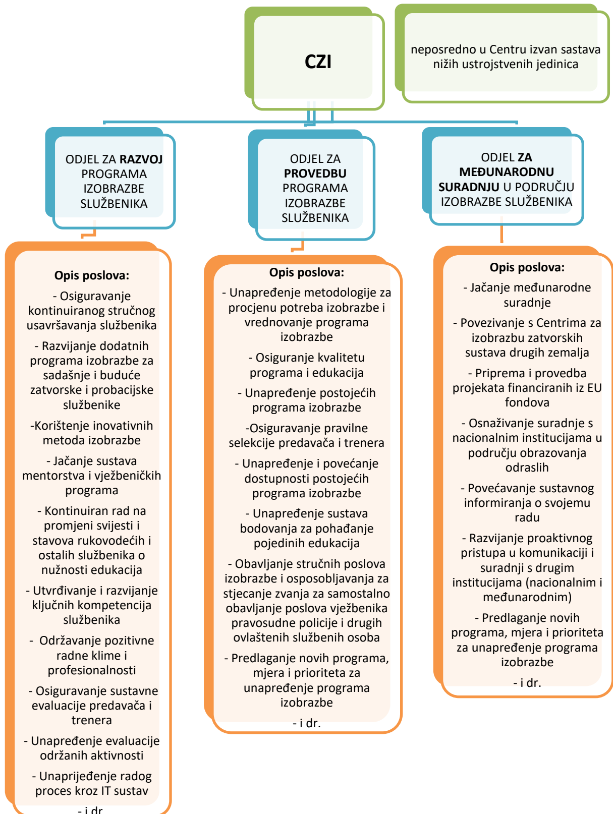
Slika 4. Poslovi pojedinih Odjela u Centru za izobrazbu